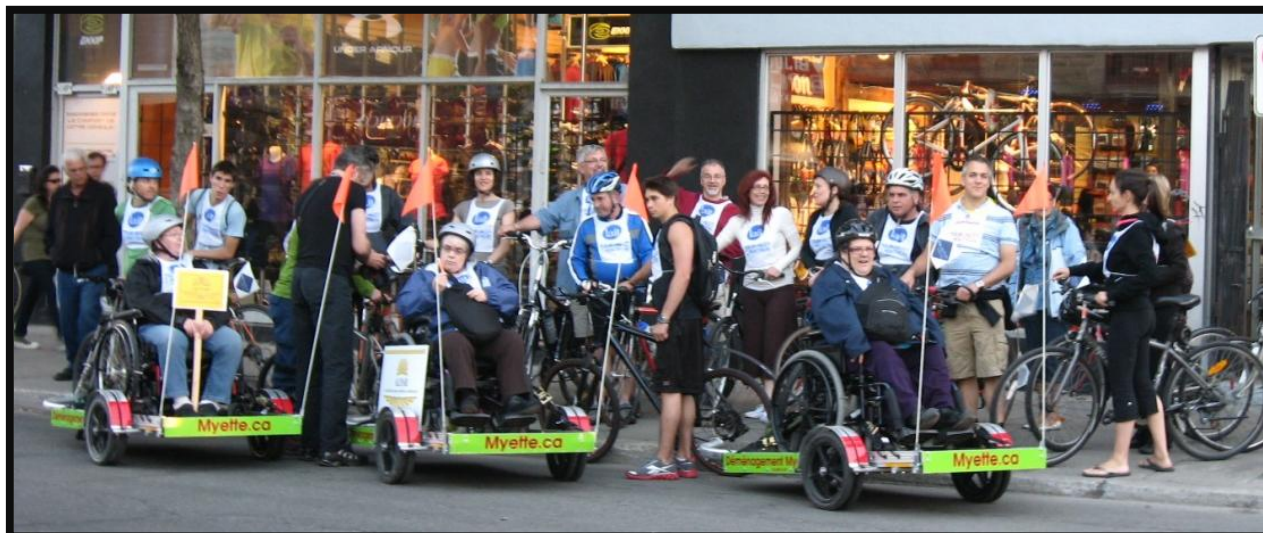
Nos 3 membres et leurs cyclistes accompagnateurs sur les plates-formes de Déménagement Myette juste avant le départ.