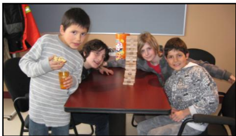
Des p'tits rayons de soleil à l'Alpar!