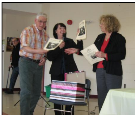
Les membres fondateurs du comité journal