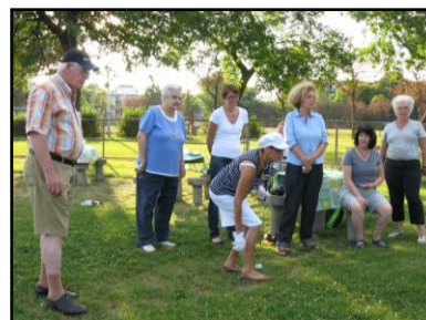
Partie de pétanque : notre présidente surveille le jeu de près...