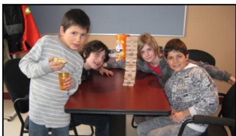
Des p'tits rayons de soleil à l'Alpar!