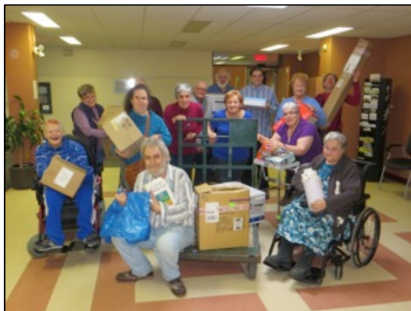
2014 : Une année de grand déploiement et de reconnaissance.

PRESENTE A L'ASSEMBLEE GENERALE ANNUELLE LE 18 MARS 20